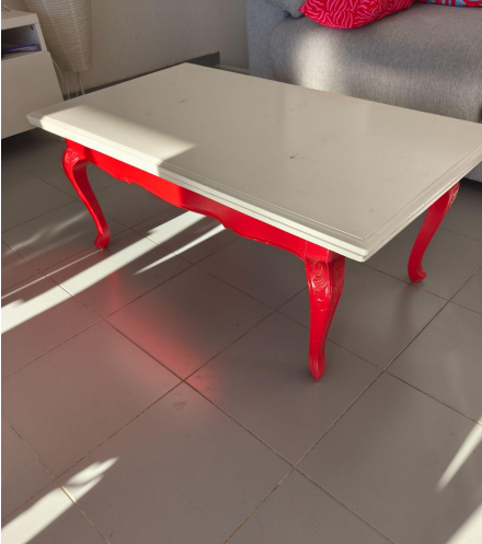
Table basse évolutive