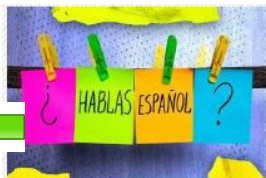
IMMERSION EN ESPAGNOL

10H30, Las Palmeras. Lunettes de soleil, chapeau, chaussures aquatiques, legging sont conseillés